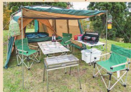
レンタル用品も充実!(写真は手ぶらセット)

日本三大峡谷「清津峡」と国の名勝・天然記念物「田代の七ツ釜」の中間地点に位置する『清田山キャンプ場』。標高550mから河岸段丘が一望できる眺めの良さやオートキャンプ場、コテージ、キャンプ施設も充実し、BBQを楽しむ方や家族連れに大人気の施設です。