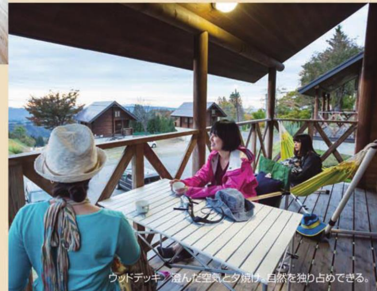
ウッドデッキで澄んだ空気と夕焼け、自然を独り占めできる。