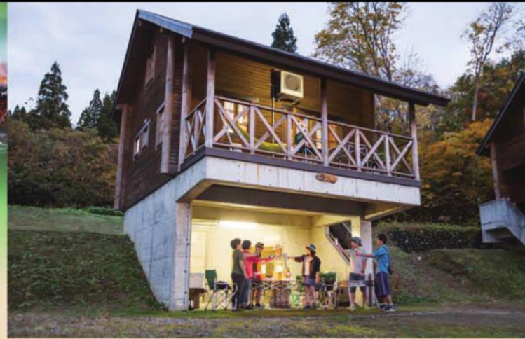
コテージ5棟 地下でバーベキューも可能